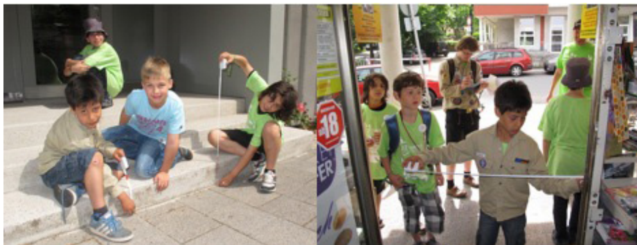
Eindrücke des 72-Stunden-Projekts aus Darmstadt

In der einjährigen Pilotphase, lag der Fokus auf der Informationsbereitstellung für Menschen mit Gehbehinderungen. Nach der erfolgreichen Einführung und Erprobung des Systems wird nun in einer zweiten Phase der Informationsumfang ausgeweitet. Die Attributtabelle wurde so erweitert, dass nun auch Informationen für Seh- und Hörbehinderte über Mobile Menschen angezeigt werden. Außerdem wurde die Homepage barrierefrei umgestaltet – u.a. sind nun Einstellung zu Schriftgröße und Kontrast möglich. Darüber hinaus werden bis Ende 2013 alle